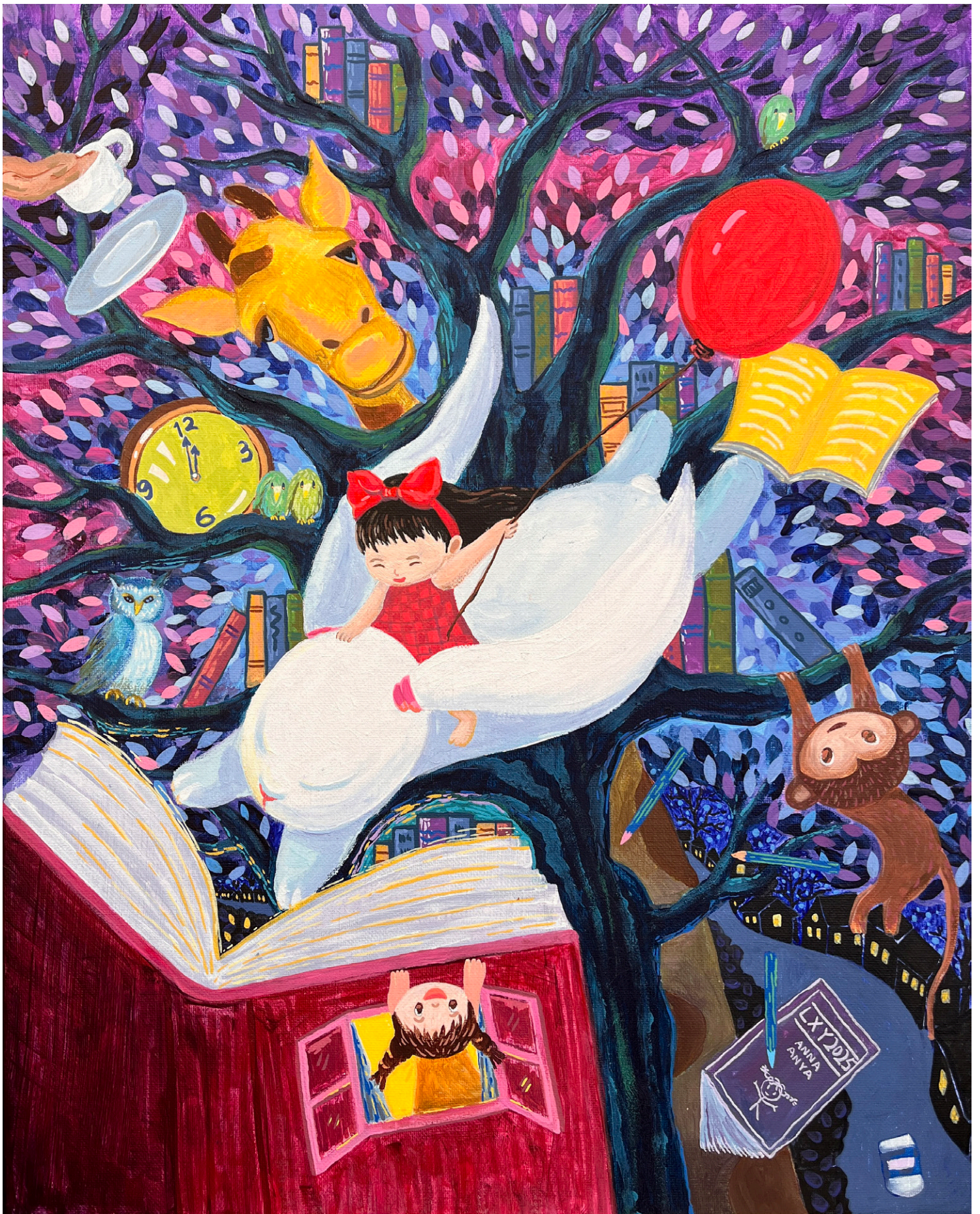
Daydream Serie, 2025